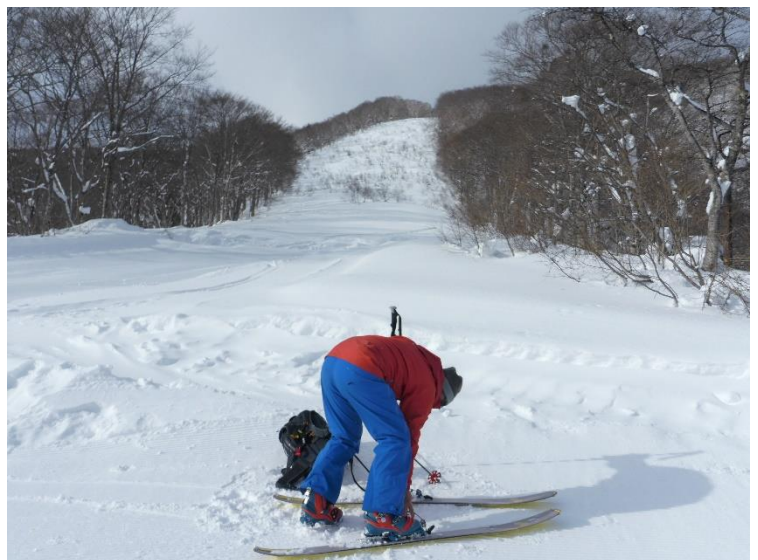
現在のゲレンデトップ この先は閉鎖ゲレンデあと