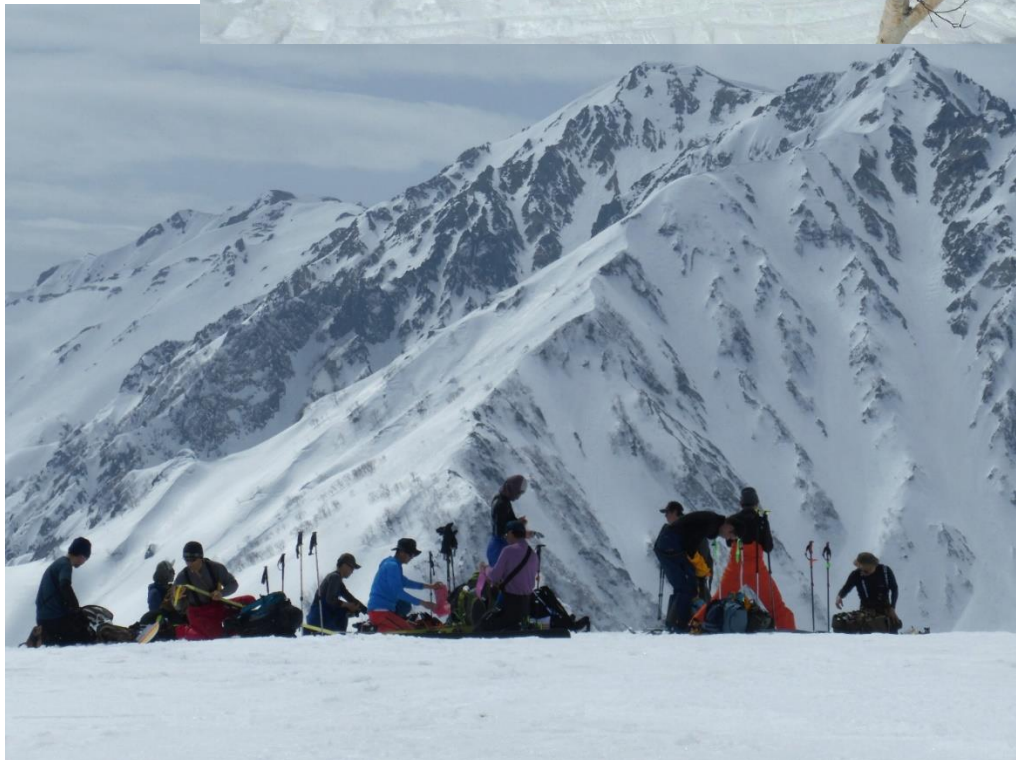
滑降準備中のツアーガイドメンバー 標高 2301m 台地ポイントにて