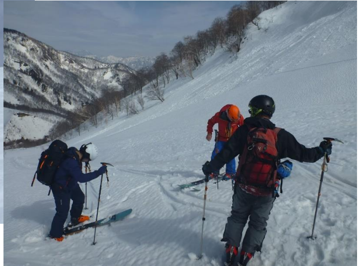
金山沢上部の雪質はそれほど重くない。