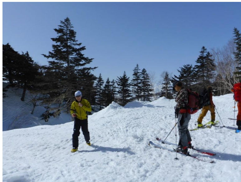
母池ロープウェイ自然園駅での出発準備