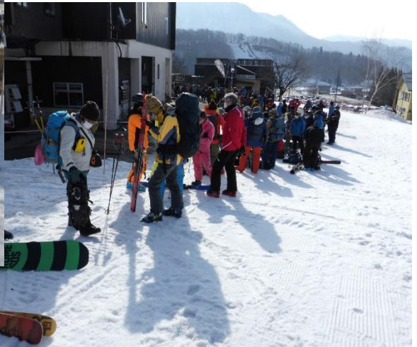
母池 Gondola 山麓駅での 始発前の乗車待行列