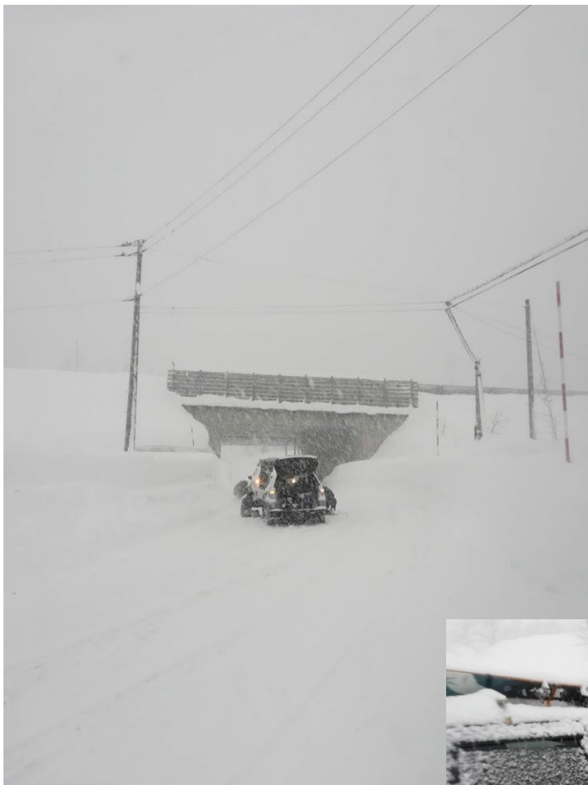
上信越道のガード下