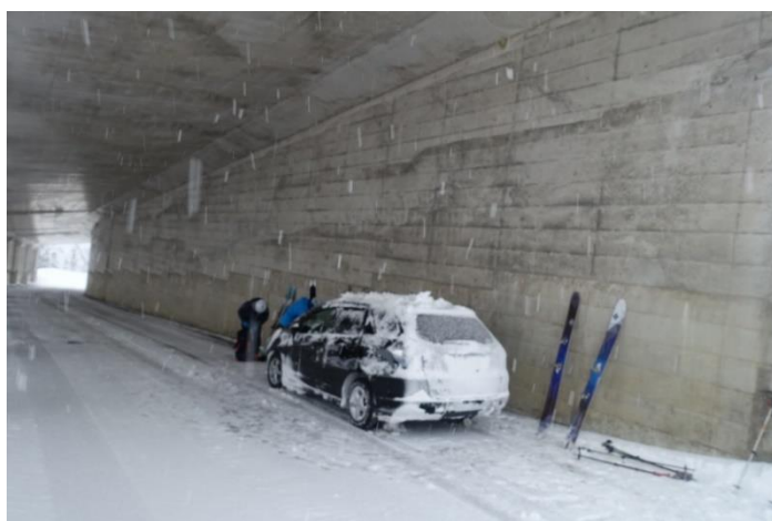
山田旅館手前のスノーシェイド