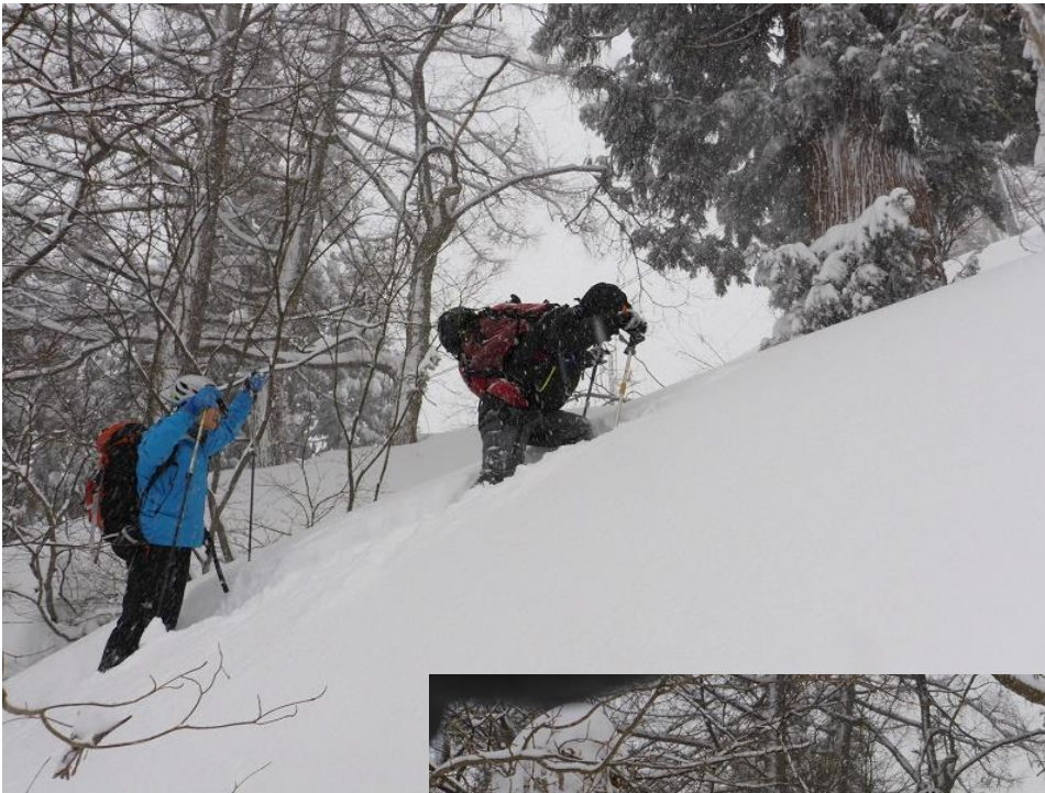
先頭は 急斜面の深雪ラッセルに かなり苦勞する