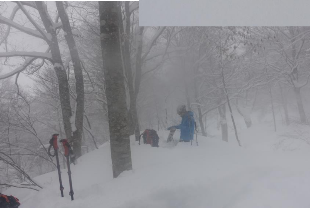
鎌池手前の平坦地まで、撤退開始。